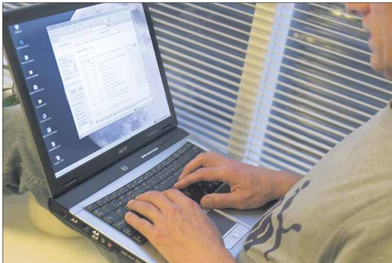
Mange medarbejdere er kommet i klemme med multimedieskatten og det har skabt stor utilfredshed bl.a. hos HK.