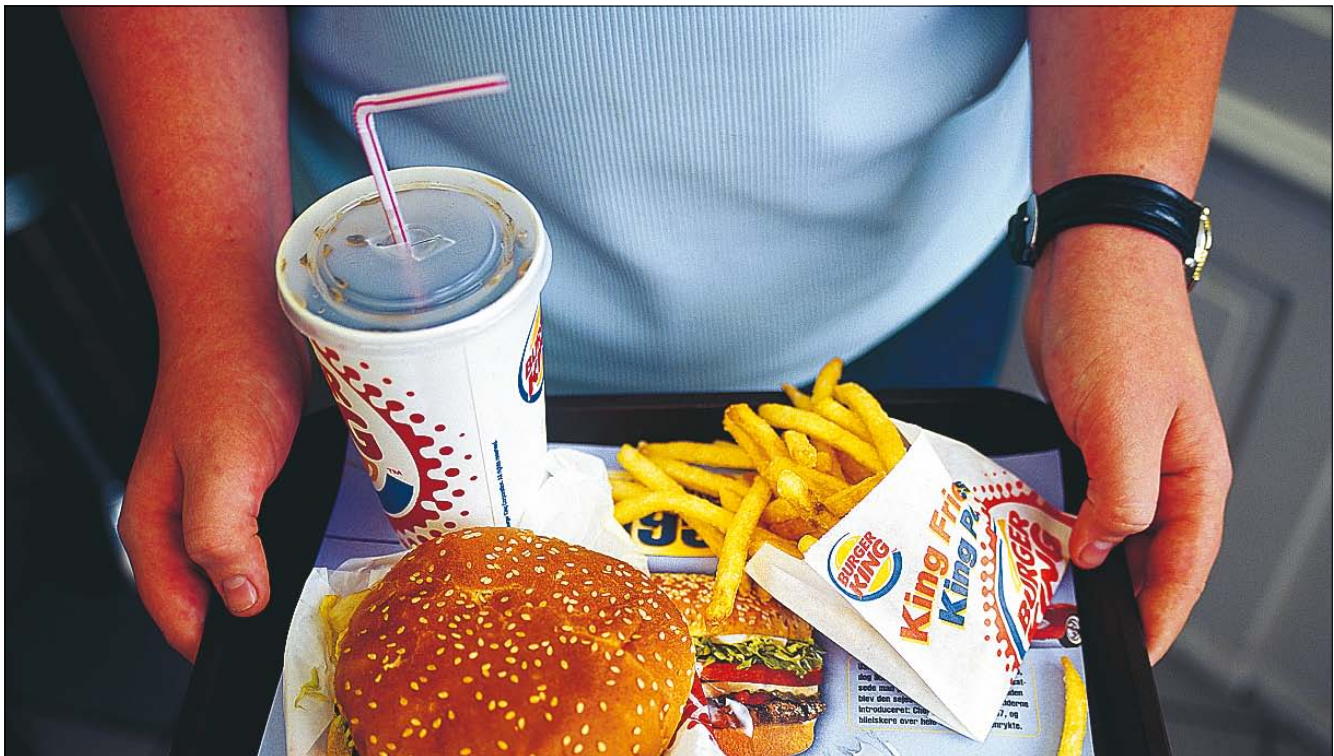
HURTIGT OG nemt - men ikke befordrende for trafiksikkerheden.

Et nyt projekt SundVej, der blandt andet tæller en gruppe chauffører, har udviklet fedtfattige og velsmagende retter i emballage, som nemt